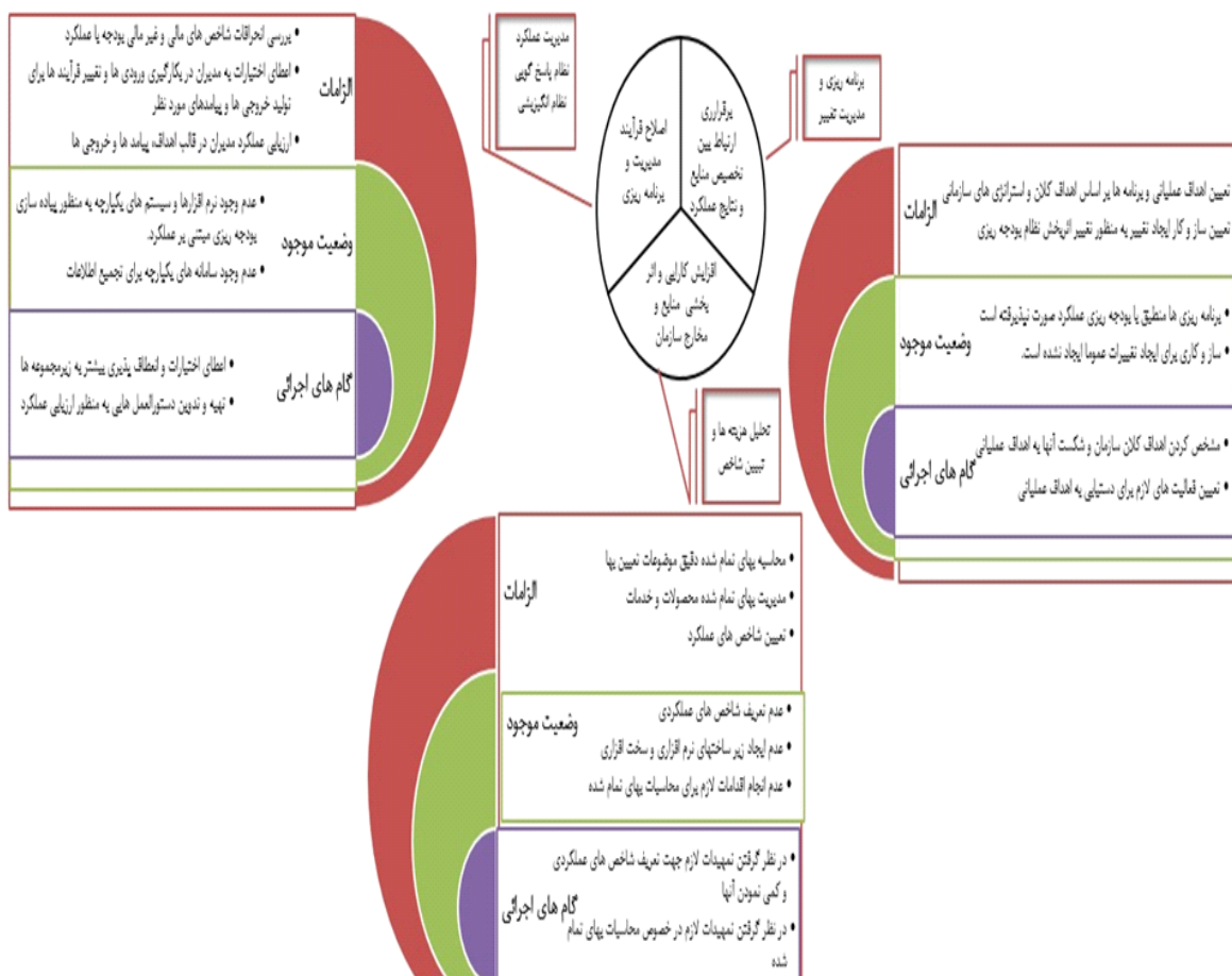
الگوی برنامه‌ریزی عملیاتی در نیروگاه‌های فسیلی